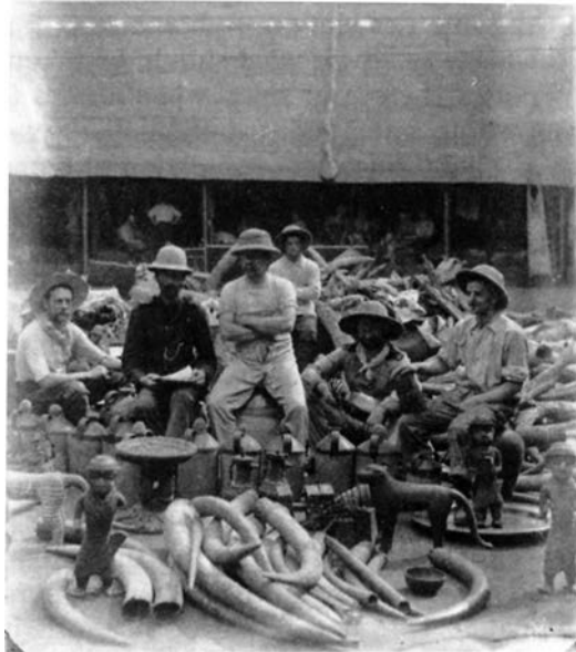
Figura 3: Oficiales británicos de la expedición de 1897 a Benín con estatuas de bronce y marfiles extraídos del complejo real.

el periódico Illustrated London News los llamó en esa época, se expusieron en el Museo Británico ese mismo año. 46 Asimismo, las fuerzas de la alianza de las ocho naciones que intervino en China en 1900 para reprimir el levantamiento de los bóxers saqueó Pekín, llevándose consigo numerosas estatuas y piezas de porcelana y jade que acabaron en los museos occidentales. Poco después, una expedición británica al Tíbet (1903-1904) dio como resultado el pillaje de varios monasterios para enriquecer las arcas de las colecciones de Occidente. 47 Tal como observó el antropólogo alemán Adolf Bastian de un modo un tanto complaciente, «las campañas militares pueden dar sus frutos en cuanto a la investigación científica y pueden ser objeto de explotación para este propósito». 48