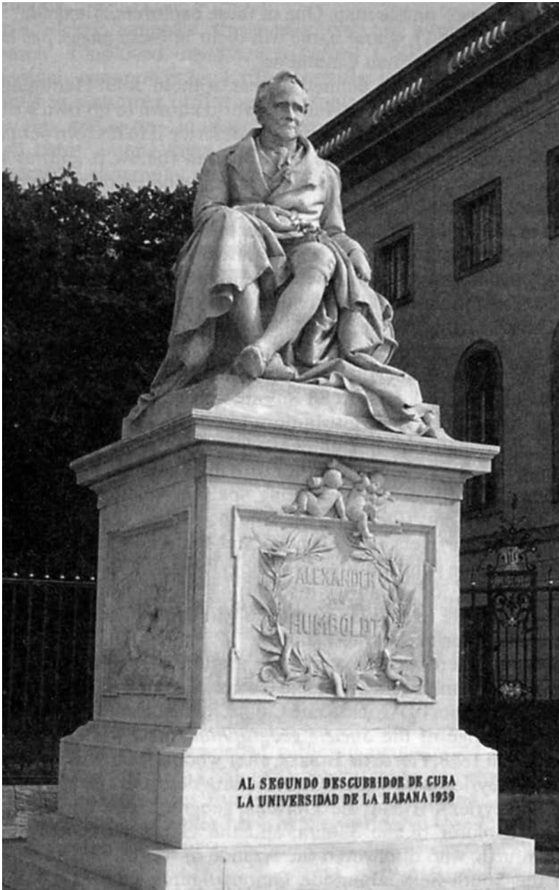
Figura 1: Alexander von Humboldt, estatua en Berlín de R. Begas (1883).