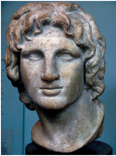
Alejandro Magno. British Museum

modificando lo que hoy llamamos Grecia y difundiendo su cultura por todo el mundo conocido entonces. En Macedonia se encontraba el lugar inalcanzable donde la Grecia arcaica situaba de manera imprecisa el jardín del legendario rey Midas, el que convertía en oro todo lo que tocaba.